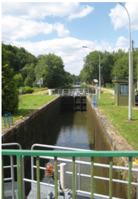
Écluse de Méloménil

Après avoir pris quelques instant auprès de l'église, faites demi-tour, repassez devant la mairie et restez de la Grande Rue (D3). Continuez toujours tout droit pour rejoindre les Forges d'Uzemain et votre point de départ.